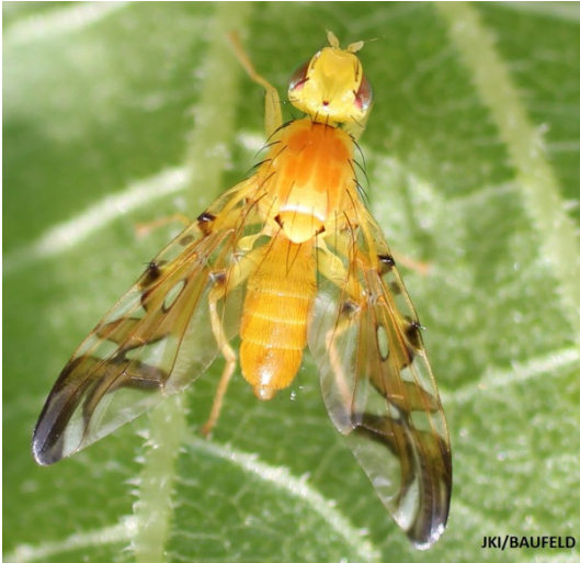
Femelle de Strauzia longipennis

Cette « mouche du tournesol » appartient à la famille des Tephritidae (mouche des fruits)