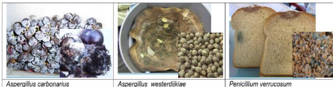
Figure 2. Aspect macroscopique d' Aspergillus carbonarius , A. westerdijkiae et Penicillium verrucosum sur des aliments moisiss (respectivement du raisin, du café/grains de café vert et du pain de mie/grains de blé)